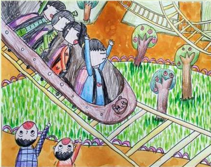
<부스러기사랑나눔회 글그림 잔치 영동상> 시립옥길지역아동센터 이예은