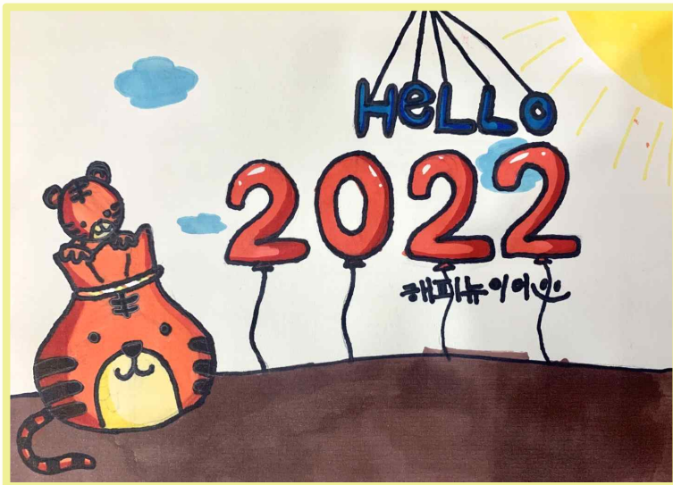
<Hello 2022 해피뉴이어> 다함께돌봄센터 복사골문화센터 홍석민